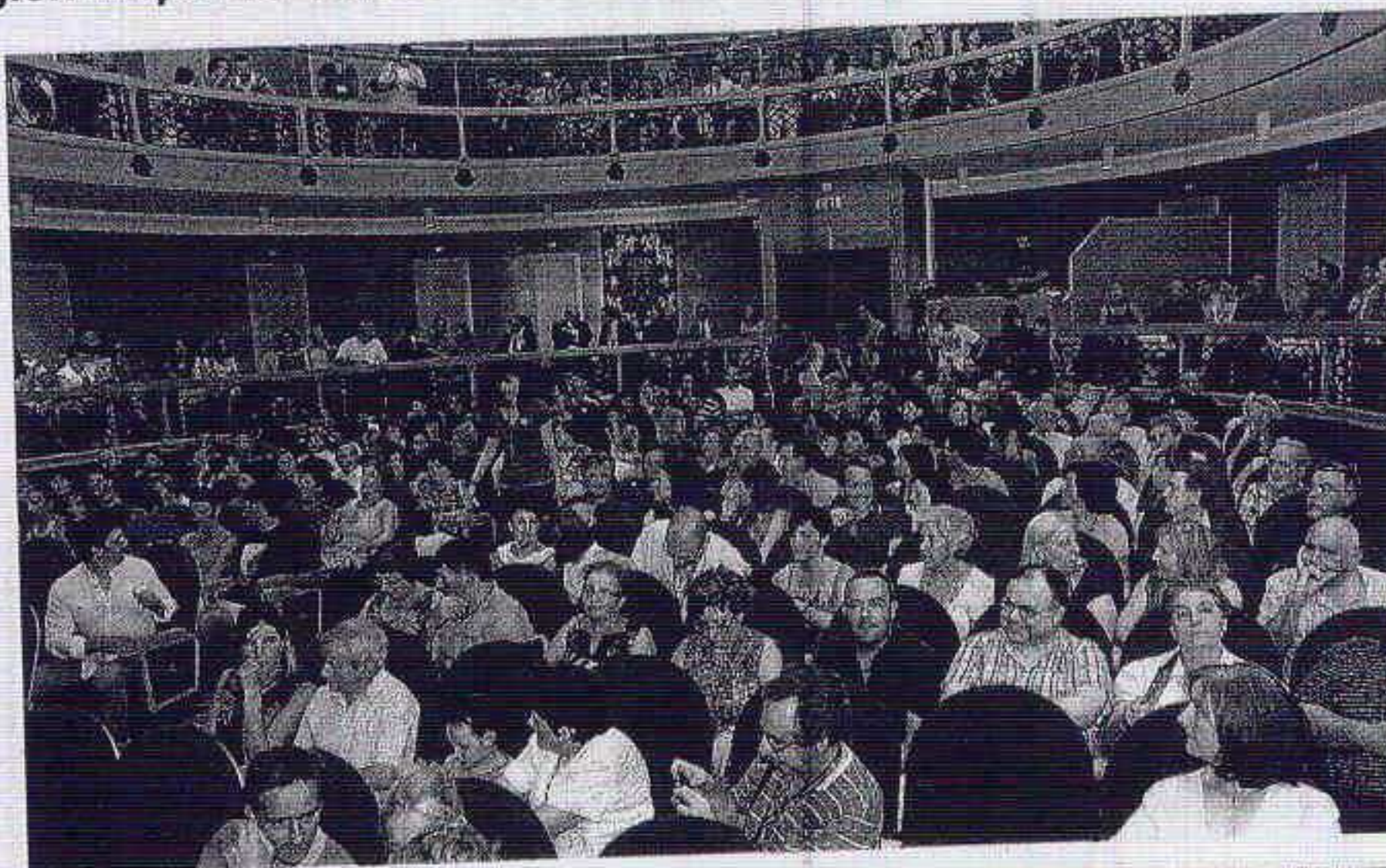
El público llenó el Teatro Nuevo "Fernando Arrabal" durante la inauguración